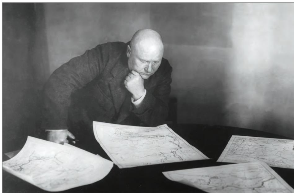
И. И. Вацетис.

Непонятно зачем 97 дней отбыл в заключении летом—осенью 1919 года и сам главком И. И. Вацетис, много сделавший для победы большевиков. В своих мемуарах он написал, что был арестован неизвестно за что 29 . Раскрывать дело о белогвардейском подполье в верхушке РККА чекисты начали с белогвардейской