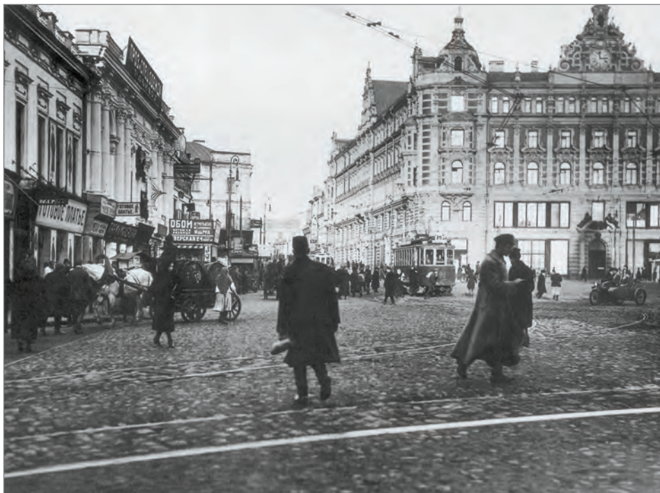
Здание Особого отдела ВЧК на Лубянке. 1920 г.

В конце Гражданской войны аресты коснулись генштабистов в основном из числа плененных белогвардейцев. В отношении к пленным генштабистам прослеживается определённая система. По данным на 1920 год не менее 30 зарегистрированных штабном 5-й армии плененных колчаковских генштабистов числилось за Особым отделом ВЧК 48 , их предполагалось отправить в Москву. Пленные в обязательном порядке становились на учёт и проходили идеологическую обработку на политических курсах. При назначениях бывших белых на должности в РККА в каждом случае требовалось запросить мнение Особого отдела. Позднее, в 1920-е, белогвардейское прошлое во многих случаях воспринималось с оттенком юмора. Например, дело арестованного колчаковского генерала А. Т. Антоновича было прекращено 30 января 1926 года Сибкрайсудом ввиду того, что «преступление носит исторический характер, и Антонович в настоящее время не является социально