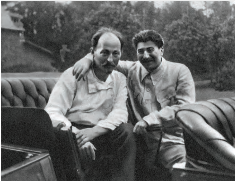
Ф. Э. Дзержинский и И. В. Сталин. 1922 г.