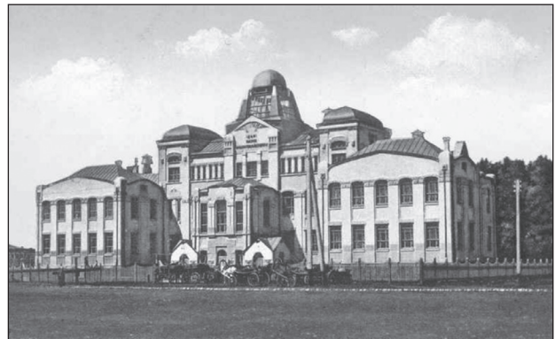
Дом науки, где располагалась академия г. Томск