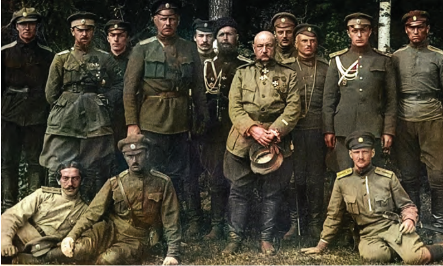
Генерал Н. Н. Юденич в штабе I стрелкового корпуса. 22 июня 1919 г.