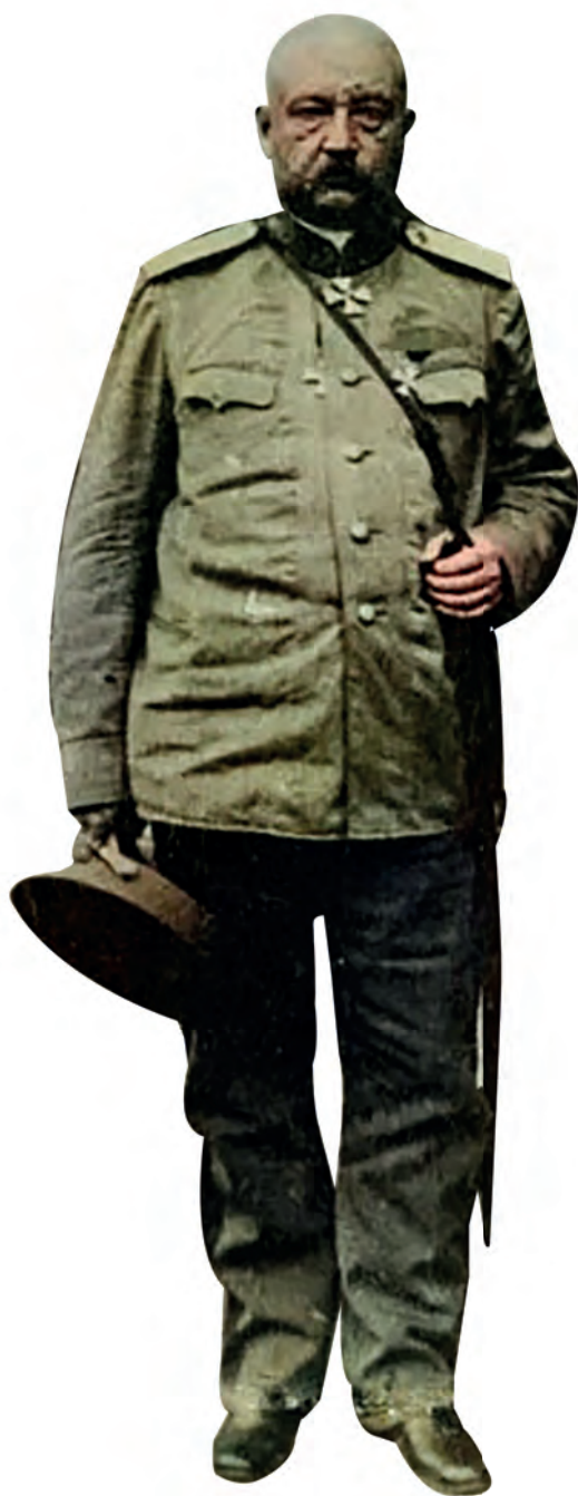
Генерал Н.Н. Юденич