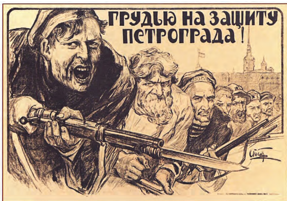
А.П. Апсит. Грудью на защиту Петрограда. Советский плакат

ГРАЖДАНСКАЯ ВОЙНА; РККА; СЕВЕРО-ЗАПАДНАЯ АРМИЯ; ПЕТРОГРАД; БЕЛОЕ ПОДПОЛЬЕ.