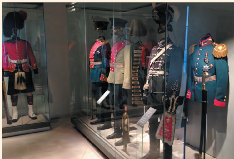
Стенд с мундирами русской армии.