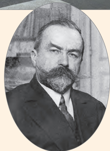
Генерал Е. К. Миллер.