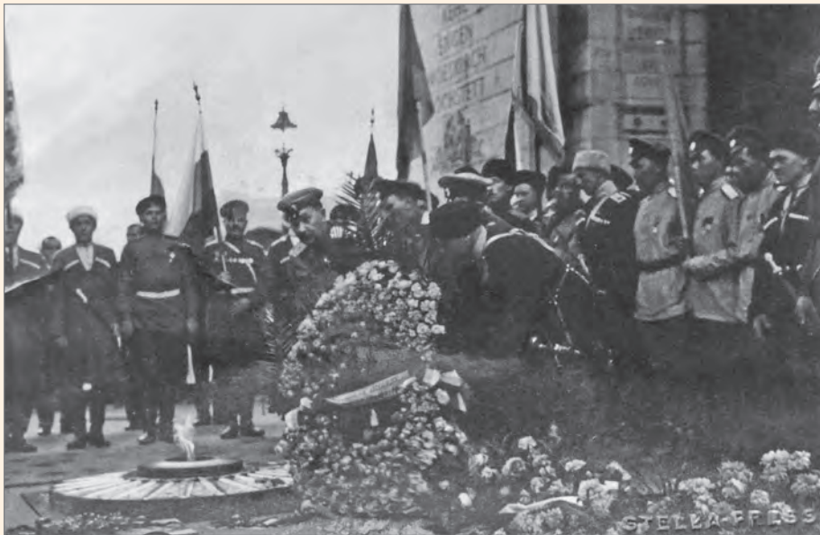
Казаки возлагают венок на могилу Неизвестного солдата. 6 сентября 1930 г.