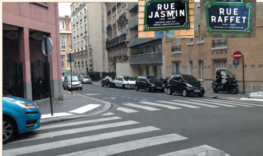
Место похищения генерала Е. К. Миллера.