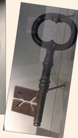
Ключ от крепости Новогеоргиевск.