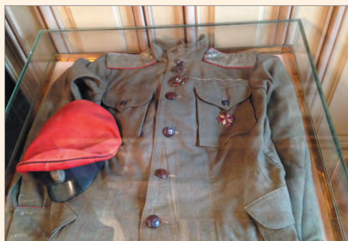
Френч и фуражка генерала П. Н. Врангеля.