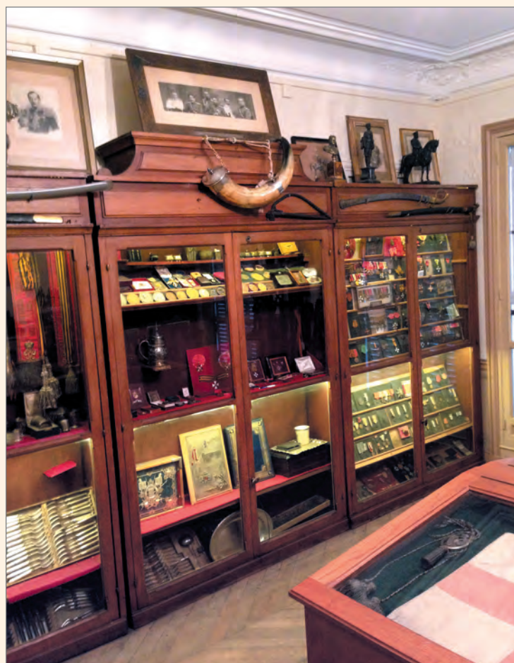
Один из залов музея.