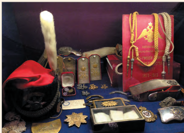
Стенды с униформой и наградами.