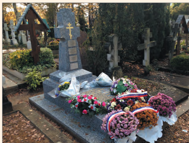
Памятник генералу Н. А. Лохвицкому, открытый осенью 2014 года.