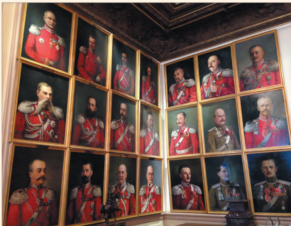
Портретная галерея командиров полка.