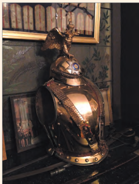
Каска и кираса гвардейских кирасир.