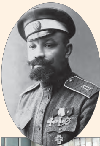
Генерал А. П. Кутепов.