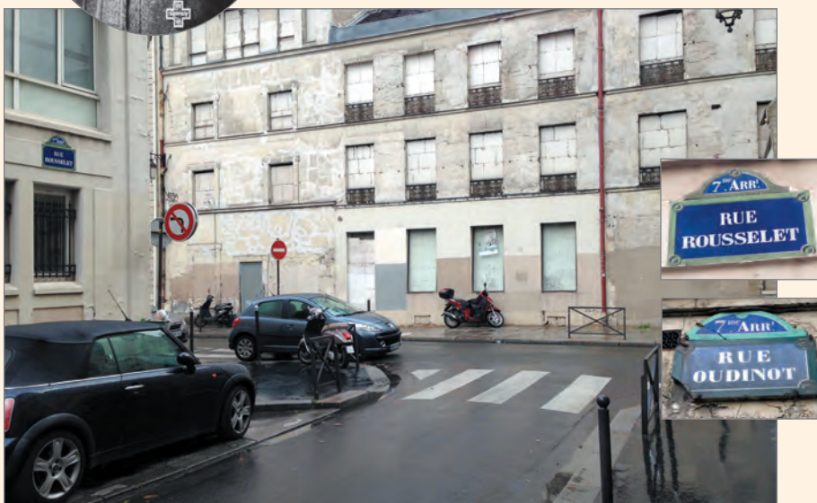
Место похищения генерала А. П. Кутепова.