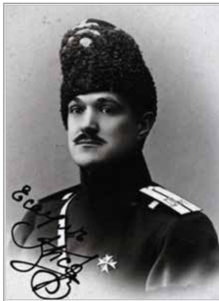
В.Ф. Эксе. Архив Ф.А. Гуцина. В оригинальном качестве публикуется впервые

Ничего не будет..., — начал он разговор, — я еще не назначен, но в ближайшем будущем...» Куда, кем не назначен и какую властью будет «назначен» этот авантюрист, думал я. Тем временем два-три десятка матросов, стуча прикладами и грязными сапогами, заняли мою гостиную. Я прошел к себе в кабинет, сел на мою оттоманку, закурил папиросу и ждал, чем же это все кончится. Тем временем моя жена успела как-то предупредить обо всем происходящем мою команду писарей и нестроевых. Начался мой, так сказать, допрос.