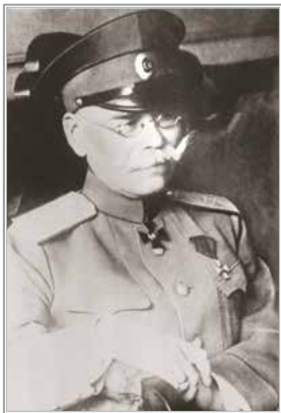
Генерал М.В. Алексеев

нилова. Оттуда шли идеи оздоровления армии, восстановления дисциплины и порядка. Ставка была выражением «контрреволюции», что приводило в смертный страх и пресловутый Совет, и самого Керенского.