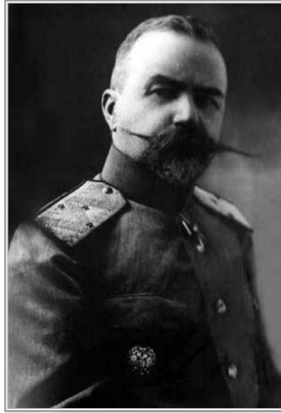
Генерал Е.К. Миллер

ного округа 73 у Плеве 74 , у Плеве же был начальником штаба главнокомандующего Северным фронтом 75 , командовал одним из корпусов на румынской границе и там был ранен в голову озверевшими солдатами на одном из митингов 76 . Сколько я знал, Е.К. Миллер был добрейший