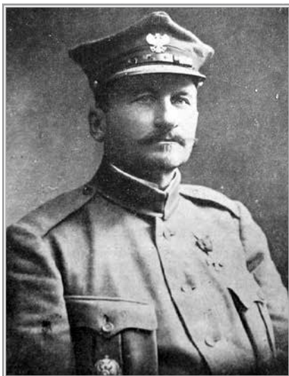
Генерал И.Р. Довбор-Мусницкий

где-то на юге. Впоследствии Довбор перебрался в Польшу, но интриги сторонников Пильсудского сломали его карьеру, и он скончался в своем имении незадолго до Второй Великой войны.