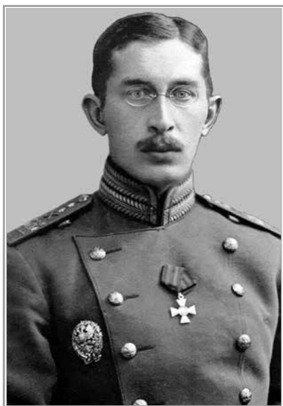
А.И. Верховский. Севастополь, ноябрь 1914 г.

Сахаров 125 , Ридигер 126 ... И вдруг — фигура можно сказать мальчишки! Надо пояснить, как создалось это назначение, исходящее целиком из революции.