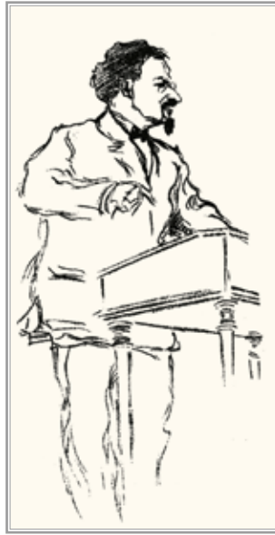
Л.Д. Троцкий. Декабрь 1917 — январь 1918 г. Рис. Ю.К. Арцыбушева

подумал, что вся работа моих ближайших предшественников состояла в верчении бюрократического колеса, в исполнении лишь условий чистого формализма.