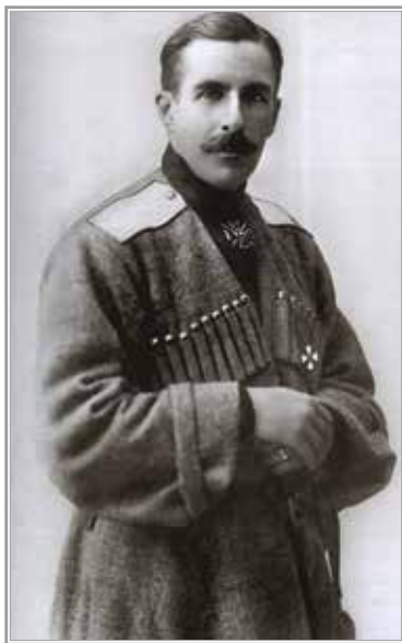
Генерал П.А. Половцов