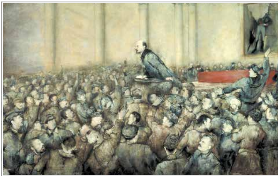
Выступление В.И. Ленина на открытии II съезда Советов.