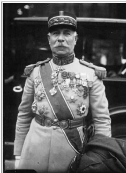
Генерал А.А. Ниссель

императора и даже — любовью маленького наследника 183 . Что касается генерала Ниэсселя — я встретился с ним в Mailly-le-Camp на французском фронте и был радостно удивлен видеть его в Петербурге.