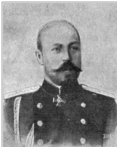
Генерал Ф.Ф. Палицын

в России, и восьмидесятилетнему 39 Палицыну нечего уже было делать во Франции. Много, много воспоминаний соединяло меня с Федором Федоровичем, но об этом поговорю несколько позже.