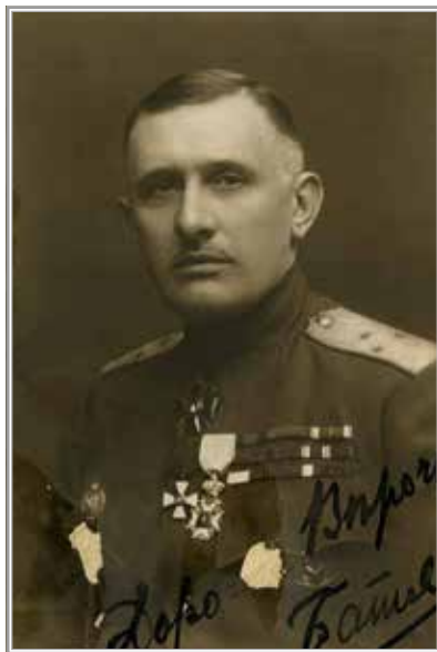
Генерал О.П. Васильковский