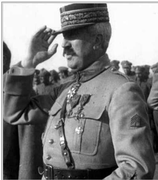
Генерал М. Жанен