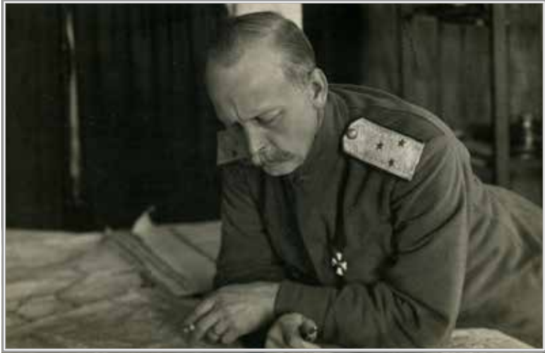
Генерал А.К. Келчевский

но о Кельчевском — в другом месте, иначе я никогда не подойду к моему посту начальника Генерального штаба.