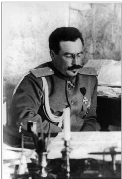
Генерал Н.Н. Духонин

тив меня, он, дорожа моим сотрудничеством, заявил, что стоит ему сказать только слово и все успокоится и будет в порядке. Связь Верховского с председателем совета Чхеидзе 198 была, видимо, приятельская, и моя травля в газетах действительно прекратилась.