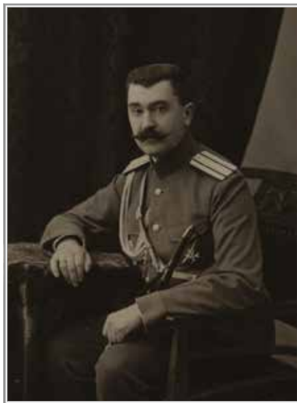
Генерал Н.Н. Головин (на фото в чине полковника).

деликатным, как для начальства академии, так и для самого Верховского.