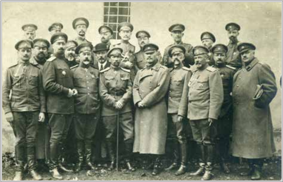
Генерал А.Г. Корнилов и его соратники под арестом в Быхове

о том и о другом, чтобы, прежде всего, сказать, что нас трое 144 были уже много лет связаны самой тесной, душевной дружбой, что мы были крепко спаяны нашей боевой работой в Маньчжурии, и что мы были близки общностью наших идей во имя служения родной армии.