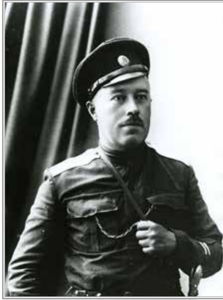
А.И. Дутов. 1918 г.

мой откровенный разговор привел бы к открытому разрыву с Верховским, что не входило в мои виды, да, вероятно, не отвечало и проектам моих французских друзей.