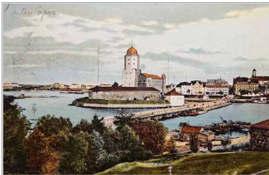
Выборг. Виден Абоский мост, на котором происходили убийства офицеров в 1917 г. Дореволюционная открытка