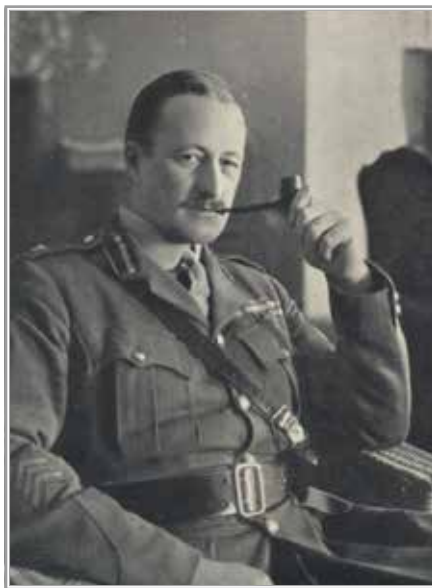
Генерал А. Нокс

убийства вел[икого] князя Сергея, родного дяди государя 185 . Еще вчера преступник — сегодня начальство, облеченное огромной властью. Ясно, что офицерство не могло переродиться в течение нескольких месяцев и лишь самые отрицательные элементы шли за революцией, частью по своей ограниченности, частью из-за чистого оппортунизма.