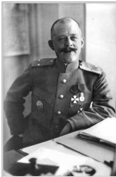
Генерал В.В. Марушевский

в Берлине, а затем с купюрами перепечатаны в СССР под редакцией П.Е. Щеголева 3 .