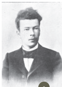
° 7 Н.С. Махров. Публикуется впервые.