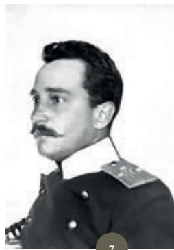
ФОТОАРХИВ Е.Д. МАРТЫНОВСКОЙ

Пожилые пары, пройдя раз из конца в конец по залу, заняли свои места... Молодежь же продолжала еще некоторое время этот элегантный неумолимый танец. За ним с передышкой начались другие, о которых я еще не имел понятия: вроде «венгерки», «Па де патр...» и др. Сули-