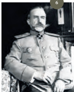
Генерал Е.К. Миллер (1867-1939).