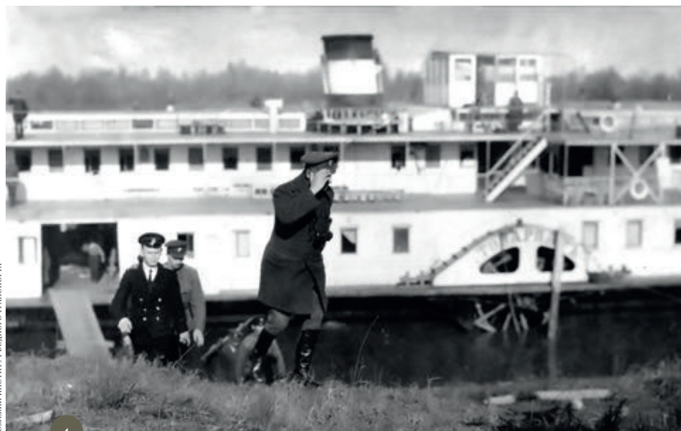
ОМСКИЙ ИНСТИТУТ ВОЕННОГО ТРАНСПОРТА

Журнал свидетельствует и о поездках Колчака на фронт. По воспоминаниям начальника штаба Западной армии генерала С.А. Щепихина, Колчак говорил, что именно на фронте отдыхает от душной омской атмосферы 28 . К февральской поездке адмирала начали готовиться заблаговременно — еще с конца января, когда личный адъютант Колчака ротмистр В.В. Князев обсуждал с инженером вопрос оборудования вагонов 29 . 8 февраля вечером Колчак покинул Омск,