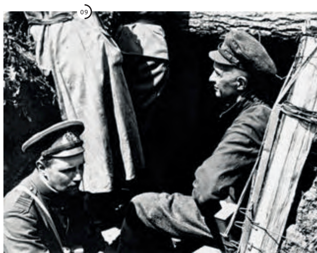
°6 Установка телефонной связи на передовой.