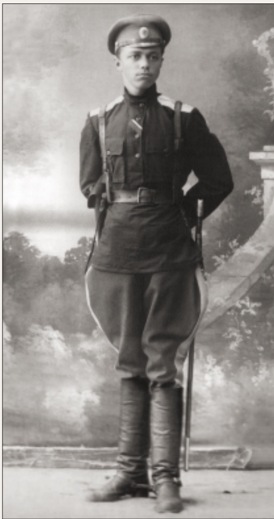
Неизвестный оренбургский казачий офицер с «Лентой Отличия» Оренбургского казачьего войска. 1918 г.

23 декабря красногвардейцы перешли в наступление, передвигаясь в эшелонах. Дутов активных действий не предпринимал. Красные доехали таким образом до станции Платовка, однако продвинуться дальше могли только с боями. Первый бой с применением артиллерии произошёл у станции Сырт. Красные заняли Сырт и 15-й разъезд. Далее на перегоне между Каргалой и Переволоцком были подпилены телеграфные