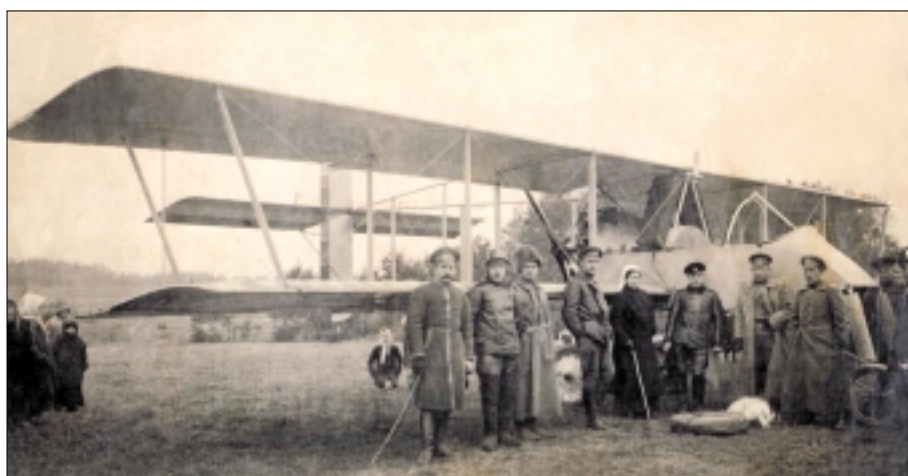
Биплан «Вуазен» (Voisin 3 тип LA) французского производства, состоявший с 1915 года на вооружении российских авиачастей. Предположительно на фото самолёт, принадлежавший оренбургскому авиаотряду. 1918 г.

За весь период своего существования отряд совершил только шесть полётов. В основном, лётчикам приходилось действовать на Орском и Ташкентском фронтах. Отчаянные авиаторы, невзирая на ужасающее состояние материальной части, осуществляли над расположением противника разведку и бомбометание, сбрасывали листовки 11 . Было осуществлено два разведывательных полёта в районе Орска 8 сентября, полёт Оренбург — Илек 9-го октября, два полёта 26 ок-