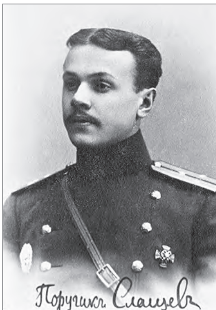
Я. А. Слащов. 1911 г. Научный архив ИРИ РАН. Публикуется впервые.