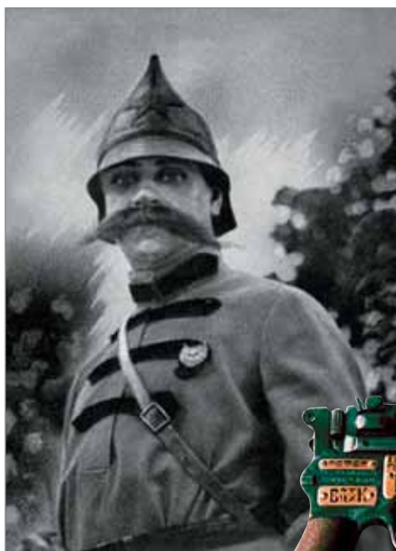
С. С. Каменев.