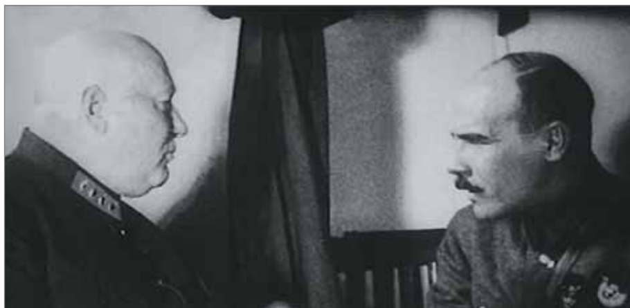
Беседа орденосцев. И. И. Вацетис и С. А. Пугачёв. Кадр кинохроники. Публикуется впервые.

Постановлением Президиума ЦИК СССР от 26 сентября 1924 года представления к награждению орденом за период Гражданской войны, до 1 января 1923 года, были запрещены. В том же году вместо республиканских орденов Красного Знамени (РСФСР и других советских республик) был учреждён единый орден Красного Знамени СССР. Однако в порядке исключения награждения за Гражданскую войну продолжались, продолжали выдаваться и знаки прежнего образца. В 1928 году, к десятилетию РККА, ордена Красного Знамени была удостоена группа военных и политических деятелей, среди которых были и те, кто в силу конъюнктурных причин не получил эту награду ранее. Награждение осуществлялось постановлением Президиума ЦИК СССР от 20 февраля 1928 года в ознаменование 10-летия РККА, «отмечая заслуги в руководстве и личном участии