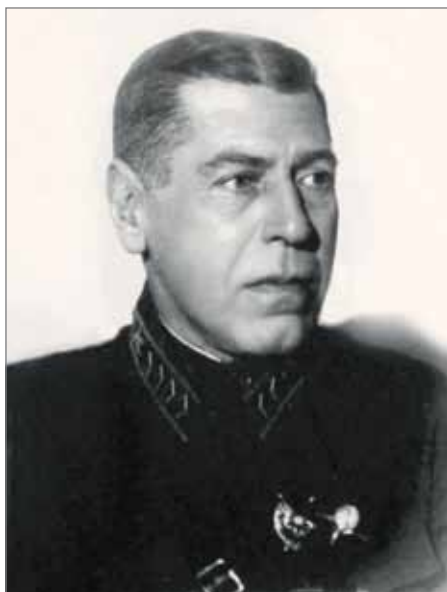
Б. М. Шапошников.