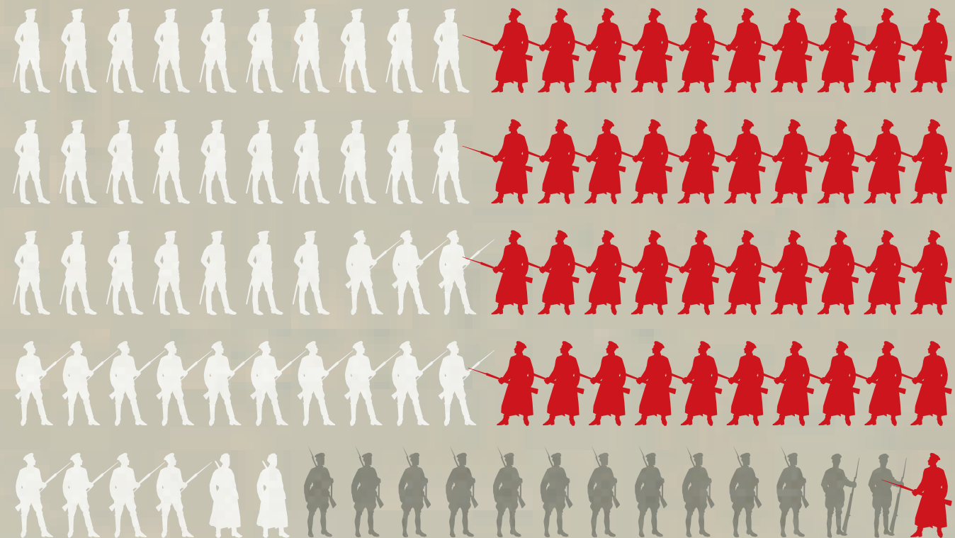
Составлено по: Ганин А.В. Корпус офицеров Генерального штаба в годы Гражданской войны 1917–1922 гг.: Справочные материалы. М.: Русский путь, 2009.

был удостоен ордена Красного Знамени, редко достававшегося представителям дореволюционной военной элиты. Шапошников пережил все волны репрессий, хотя и на него собирався компрометирующий материал, которому по каким-то причинам не был дан ход. Хотя большая часть генштабистов оказалась среди противников большевиков (см. рисунок), красные смогли поставить себе на службу такое количество генштабистов, которое, пусть и по минимуму (для многомиллионной армии), но позволяло им решать военные задачи. Антибольшевистский лагерь, в отличие от Советской России, так и не стал единым военным лагерем, что