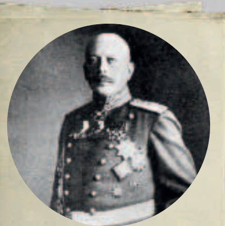
Служивший у красных генерал Андрей Зайончковский был выдающимся офицером Генерального штаба и военным историком. Его труды по истории Крымской и Первой мировой войн до сих пор остаются непревзойденными. В Гражданскую войну Зайончковского неоднократно арестовывали. Впоследствии он и его дочь были вынуждены стать осведомителями органов госбезопасности.

Красные командиры создавали новые традиции на основе старых (на фото — 38-й Рогожско-Симоновский полк на Красной площади в Москве перед отправкой на Южный фронт, 1918 год)