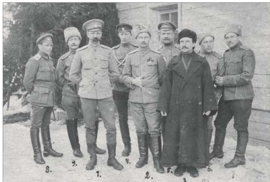
Группа офицеров 48-го пехотного Одесского полка на позиции перед штабным домиком.

В расстрельном деле Раша всего несколько листов, содержание которых способно вызвать лишь недоумение. Из документов следует, что вся «вина» арестованного заключалась лишь в том, что он зашёл в гости к своему старому