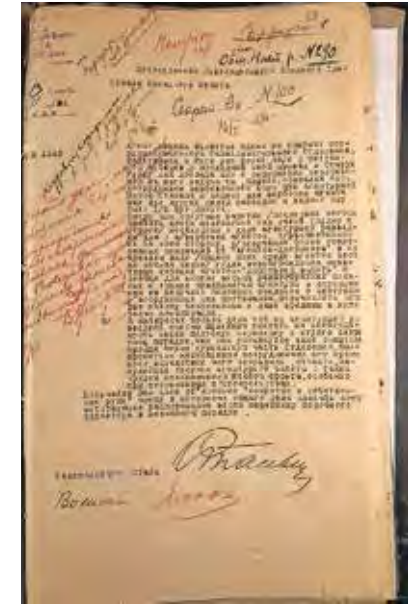
Ил. 6. Объяснения В. Е. Стасевича. Публикуется впервые

му в Риге два с половиной месяца и согласившемуся стать сотрудником вербовочного бюро при агентурной школе штаба фронта, выдали «для вербовки агента или для других целей разведки» полбутылки спирта 14 . Также сообщалось, что Стасевичу в Риге достали 20 бутылок коньяка 15 .