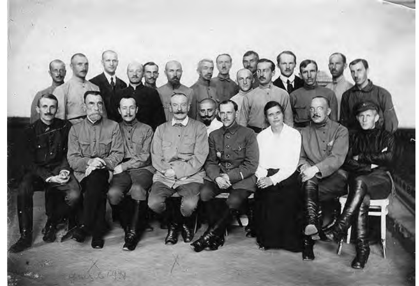
Ил. 3. Работники штаба 16-й армии Западного фронта. Июнь — июль 1919 г.

рой, чтобы быть поближе к деньгам. В то же время дело разведки было им поставлено весьма странным образом. Жаткевич понабирал в качестве агентов несовершеннолетних мальчиков в возрасте от 16 до 19 лет, находился с ними в подозрительно-интимных отношениях, что явно бросалось в глаза окружающим, стал расходовать народные деньги в огромном количестве, выражаясь его же словами: “У меня все пошло полным ходом”» 9 .