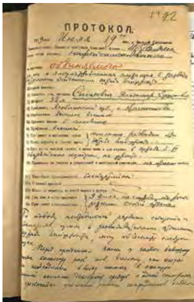
Ил. 7. Протокол допроса В. Е. Стасевича. РГВА. Публикуется впервые