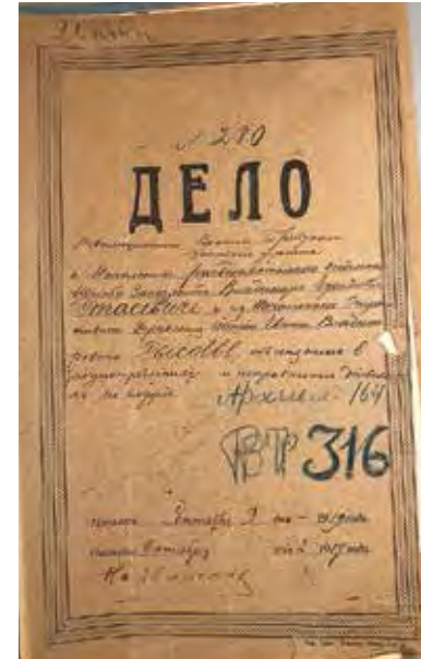
Ил. 5. Обложка следственного дела. Публикуется впервые