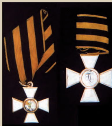
Самая почетная и высокая боевая офицерская награда — орден Св. Георгия 4-й степени (лицевая и оборотная стороны).