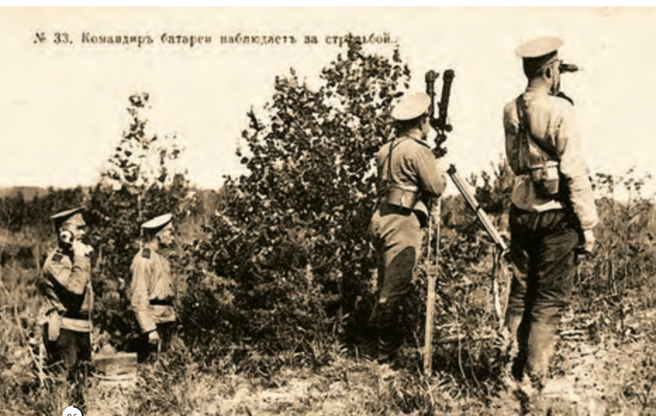
№ 33. Командир батареи наблюдает за стрельбой.