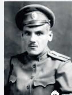
°9 Прaporщик Н.В. Крыленко (1885-1938).