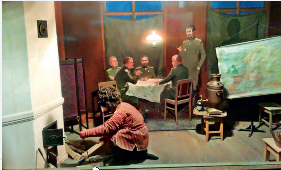
°5 Генерал М.Д. Бонч-Бруевич (1870–1956).