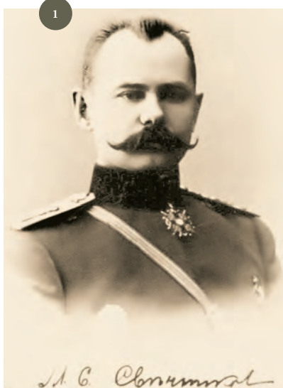
1 М.С. Свечников. 1911 г. Публикуется впервые.

Биография Свечникова за столетие подверглась немалым искажениям. В советское время о нем восторженно писали как о первом начдиве-большевике 2 . Пытаясь объяснить причины сравнительно раннего политического выбора Свечникова, авторы приписывали этому офицеру желаемые им мысли. Например, о том, что к январю 1917 г. Свечников якобы «пришел к твердому убеждению, что виновником поражения России... является самодержавие. И как человек честный, человек решительных действий, он становится на путь революционной борьбы» 3 . В постсоветский период деятельность Свечникова также освещалась с искажениями. Проанализируем политическую карьеру Свечникова, чтобы понять подлинные мотивы его поступков и хитросплетения революционной карьеры.