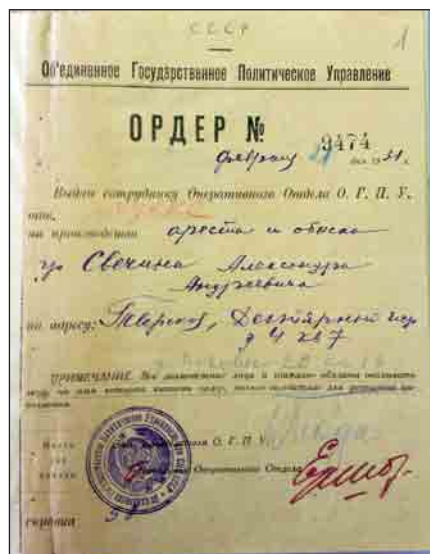
Ордер на арест. Публикуется впервые. Arrest warrant. Published for the first time