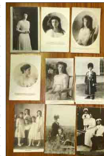
Изъятые материалы. Публикуется впервые. Excluded materials. Published for the first time