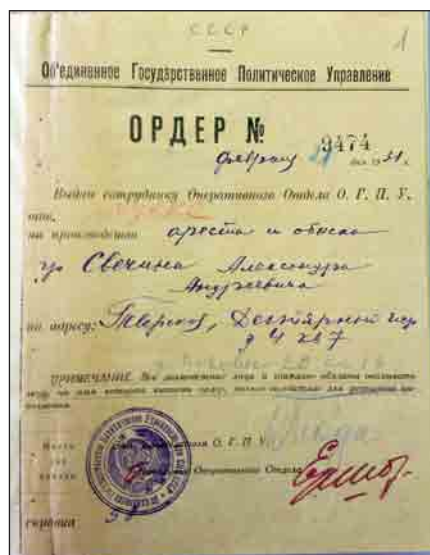
Ордер на арест. Публикуется впервые. Arrest warrant. Published for the first time