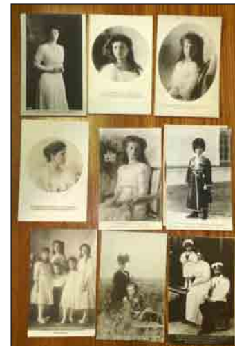
Изъятые материалы. Публикуется впервые. Excluded materials. Published for the first time