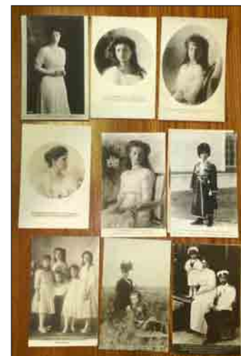
Изъятые материалы. Публикуется впервые. Excluded materials. Published for the first time