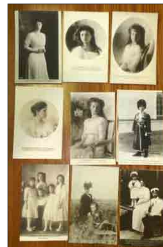
Изъятые материалы. Публикуется впервые. Excluded materials. Published for the first time

чин упоминал среди изъятого еще один чемодан с документами и золотую цепочку от часов 9 . Изъятые ценности были приняты комендатурой административно-организационного управления ОГПУ 10 . Чемодан с книгами и письмами был опечатан и оставлен на хранение супруге арестованного под расписку о сдаче его по требованию ОГПУ 11 . Среди изъятого оказалась чековая книжка Свечина, ссудное свидетельство и 218 руб., которые были переданы ячейке Осоавиахима Военной академии РККА 12 . В деле сохранились изъятые у Свечина материалы – 13 открыток с изображениями представителей семьи императора Николая II и письмо брата М.А. Свечина из Франции от 9 апреля 1928 г. 13