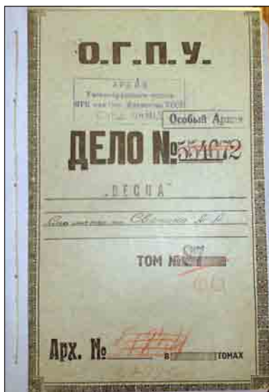
Обложка дела. Cover of the file

Дело открывает ордер ОГПУ № 9474 от 21 февраля 1931 г. на производство ареста и обыска у Свечина по адресу Москва, Дегтярный переулочек, д. 4, кв. 7, выданный сотруднику оперативно-го отдела ОГПУ Мукке и подписанный заместителем председателя ОГПУ Г.Г. Ягодой и начальником оперативного отдела Ершовым 7 . При обыске у Свечина, произведенном комиссаром оперативного отдела Кулешевым в присутствии понятых, были изъяты: револьвер «Наган» с 14 патронами и кобурой, две пары золотых часов на цепочке, два знака ордена Св. Георгия в футляре с золотой монограммой, Георгиевское оружие с надписью «За храбрость», а также чемодан с письмами и документы 8 . Позднее Све-