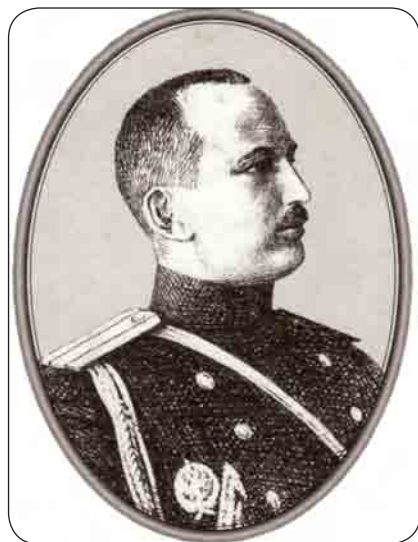
А.А. Свечин в старой армии. A.A. Svechin in the old army

мели выстрелы, они оказались не только не нужны властям, но и воспринимались как потенциальная угроза безопасности Советской России, а затем и СССР. Положение этой группы лиц усугубилось с приходом к власти такого яркого противника политики привлечения бывших офицеров на службу в РККА каким был И.В. Сталин. Произошло это не сразу, но именно бывшие офицеры стали одной из первых жертв массовых репрессивных кампаний, которые проводились в СССР в конце 1920-х – начале 1930-х гг.