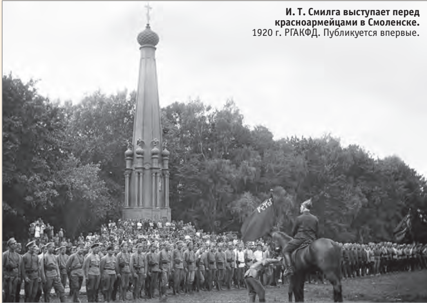
И. Т. Смилга выступает перед красноармейцами в Смоленске. 1920 г. Публикуется впервые.

но он по пути взят Бродов[ским] и Селезневым к Смилге, к[ото]р[ый] прибыл ревизовать армии (предс[едатель] Пол[итического] от[дела] Ставки 50 )... Я молюсь и слушаю проповедь... Около меня некто, к[ото]р[ый] меня стесняет... пока не начинает креститься и громко отвечать: «Вои[стину] воскресе...»... Вечером я, Вадбол[ьский], Мячк[ов] 51 и Па-