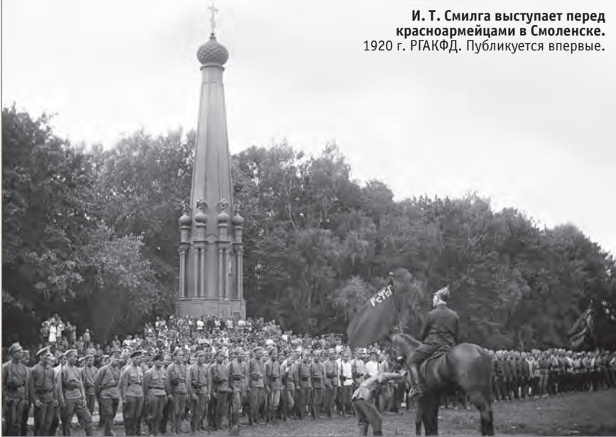
И. Т. Смилга выступает перед красноармейцами в Смоленске. 1920 г. Публикуется впервые.

но он по пути взят Бродов[ским] и Селезневый к Смилге, к[ото]р[ый] прибыл ревизовать армии (предс[едатель] Пол[итического] от[дела] Ставки 50 )... Я молюсь и слушаю проповедь... Около меня некто, к[ото]р[ый] меня стесняет... пока не начинает креститься и громко отвечать: «Вои[стину] воскресе...»... Вечером я, Вадбол[ьский], Мячк[ов] 51 и Па-