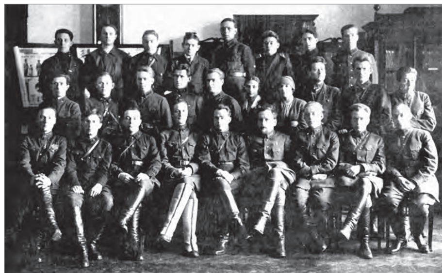
Следственный отдел полномочного представительства ОГПУ Нижне-Волжского края.

Показания коснулись и прежних сослуживцев Глазунова (он дал показания на 14 человек, служивших на 1-х Саратовских советских командных курсах): «Все указанные офицеры были одной идеологии, враждебной советскому правительству, за исключением Вакулича 31 , вступившего в партию. С большинством указанных офицеров мне приходилось вести разговор на политические темы, как в здании [саратовских] курсов, так и при случайных встречах на улице. Разговоры эти имели враждебный правительству характер»