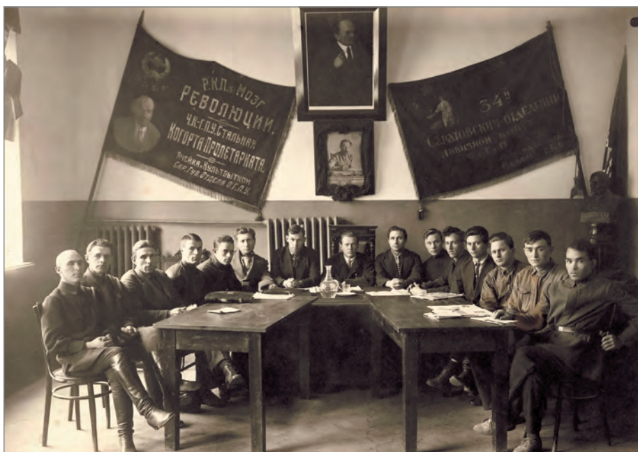
Саратовские чекисты. 1929 г. Публикуется впервые.

(показания от 15 ноября 1930 года) 32 . Впрочем, отмечал он и то, что «все эти бывшие офицеры исполняли свои обязанности преподавателей очень старательно, по крайней мере никому из них не было объявлено не только выговоров, но даже замечаний» 33 .