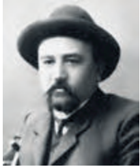
Александр Иванович Куприн (1870–1938) — писатель, переводчик.

Здесь. Родился в Пензенской губернии. После краткой военной службы вышел в отставку, начал печататься в журналах. Получил известность как автор рассказов и повестей (наиболее известна повесть «Поединок», изданная в 1905 году). В 1918 году был арестован. Считается автором укоренившегося пренебрежительного наименования Советской России — «Совдепия». В 1919 году служил у белых, редактируя армейскую газету «Приневский край». В конце 1919 года покинул Россию вместе с остатками отступившей в Эстонию Северо-Западной армии белых.