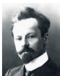
Константин Дмитриевич Бальмонт (1867–1942) — поэт, переводчик.

Здесь. Родился во Владимирской губернии. Яркий представитель символизма в поэзии Серебряного века. После участия в Первой русской революции несколько лет (1906–1913) провел в эмиграции. Знал около 30 иностранных языков, занимался переводами. В 1920 году уехал в легальную командировку во Францию и в Россию не вернулся.