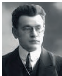
Аркадий Тимофеевич Аверченко (1881–1925) — писатель, сатирик, драматург.

Здесь. Родился в Севастополе. Опубликовал несколько десятков сборников рассказов. Издавал журнал «Новый Сатирикон». После его закрытия оказался на стороне антибольшевистских сил. Работал в различных газетах Юга России. В ноябре 1920 года эвакуировался вместе с врангелевцами в Константинополь.