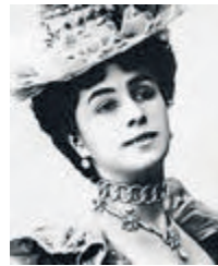
Матильда Феликсовна Кшесинская (1872–1971) — балерина и педагог.

Снова здесь. В 1937 году по приглашению правительства СССР вернулся на Родину и вскоре умер в Ленинграде.