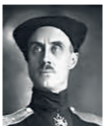
Петр Николаевич Врангель (1878–1928) — генерал-лейтенант.

Умер в Ленинграде, похоронен на Новодевичьем кладбище в Москве.