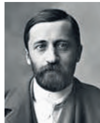
Дмитрий Сергеевич Мережковский (1865–1941) — писатель, поэт, литературный критик, переводчик.

Здесь. Родился в Санкт-Петербурге. Один из основоположников символизма и жанра историко-философского романа. Пользовался популярностью как автор философских эссе о русской и мировой литературе. Автор романов, направленных против самодержавия. Приветствовал падение монархии, но не принял приход к власти большевиков. В конце 1919 года эмигрировал в Польшу. Участвовал в антибольшевистском движении вместе со знаменитым эсером-террористом Борисом Савинковым.