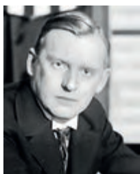
Александр Александрович Алехин (1892–1946) — шахматист, чемпион мира по шахматам.

Там. Жил и умер в Праге. Опубликовал несколько сборников рассказов, пьесу «Игра со смертью» и юмористический роман «Шутка мещената». Многие рассказы были переведены на чешский язык, несколько — экранизированы.