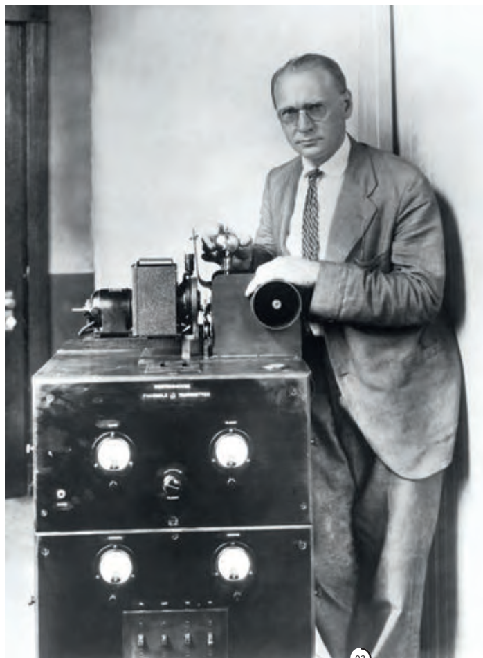
Владимир Кузьмич Зворыкин (1889–1982) — инженер и изобретатель, один из основоположников телевидения.

Умер в Брюсселе, похоронен в русской церкви Белграда.