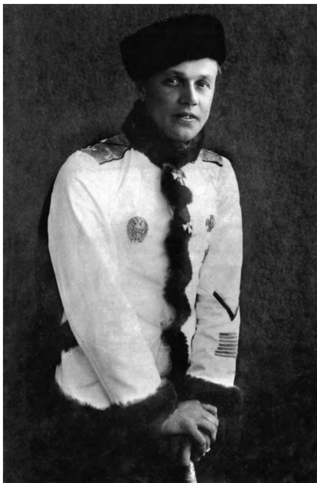
Генерал Я.А. Слащёв. 1920 г.

Слащёв упрекал Коновалова и начальника штаба Врангеля генерала П.Н. Шатилова в болтливости, которая якобы даже нарушала военную тайну 44 . О событиях 1919 г., когда Слащёв также служил вместе с Коноваловым, он свидетельствовал: «Коновалов... служил у Боровского в Крымско-Азовской армии, играл первую скрипку в его штабе, все распоряжения которого приводили к тяжелым переживаниям и к сдаче весной 1919 г. Северной Таврии и Крыма. Как раз я в это время познакомился с ним, так как я прибыл в Крым на должность комбрига 5 и вступил во временное командование этой дивизией на Акманайской позиции (Керченский полуостров), которую Коновалов приговорил к сдаче» 45 . Якобы Коновалов