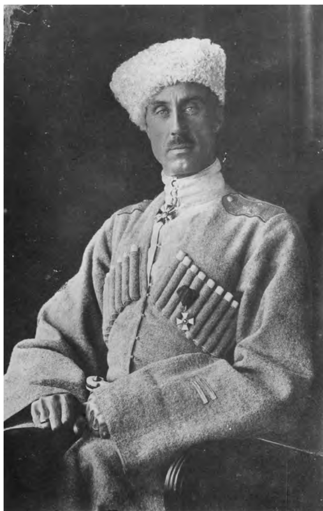
Генерал П.Н. Врангель