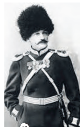
°7 Визави полковника Гатовского отличился в сражении под Мукденом в 1905 году. Открытка. Начало XX века.