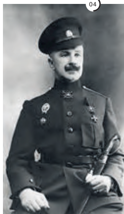
4 Полковник Владимир Гатовский незадолго до разжалования.