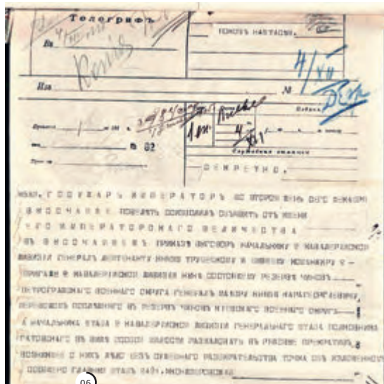
°6 Телеграмма с вердиктом императора Николая II по поводу инцидента. РГВИА.