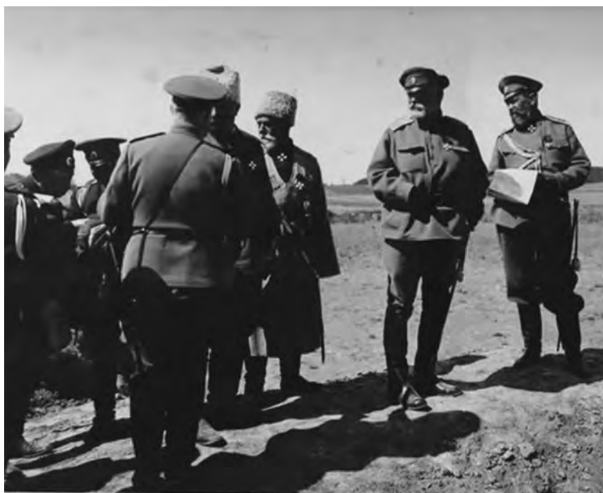
А.Е. Эверт в III Кавказском корпусе. 12 мая 1916 г. Архив И.В. Эверт. Публикуется впервые

Андрей Ганин. Ирена Эверт «Я служил, но проглядел жизнь с ее радостями». Послереволюционный дневник и тюремные письма генерала А.Е. Эверта. 1918 г.