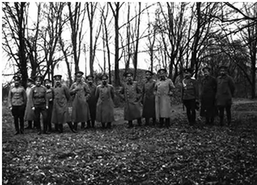
Штаб 4-й армии. Публикуется впервые