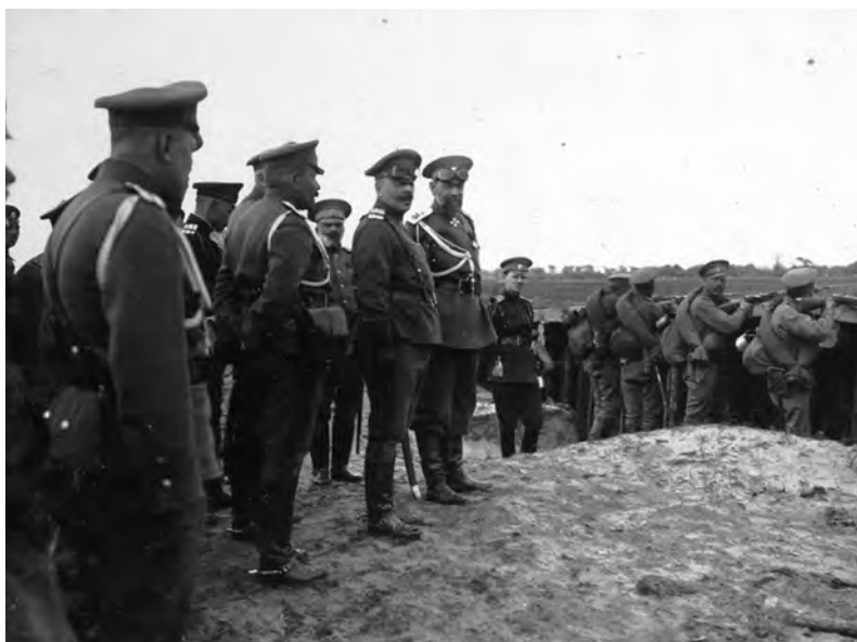
А.Е. Эверт на смотре в XXVI армейском корпусе. 4 января 1916 г. Архив И.В. Эверт. Публикуется впервые