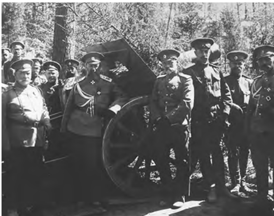
А.Е. Эверт с чинами тяжелой батареи Гренадерского корпуса. 18 мая 1916 г. Публикуется впервые