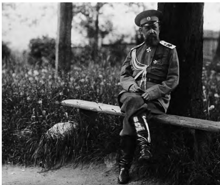
В минуты отдыха.

Андрей Ганин. Ирена Эверт «Я служил, но проглядел жизнь с ее радостями». Послереволюционный дневник и тюремные письма генерала А.Е. Эверта. 1918 г.