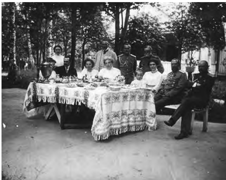
Генерал А.Е. Эверт с семьей и друзьями на отдыхе. Публикуется впервые