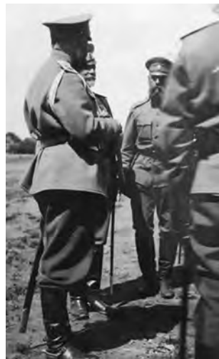
А.Е. Эверт в 3-й Гренадерской дивизии. 23 мая 1916 г. Архив И.В. Эверт. Публикуется впервые

Андрей Ганин. Ирена Эверт «Я служил, но проглядел жизнь с ее радостями». Послереволюционный дневник и тюремные письма генерала А.Е. Эверта. 1918 г.