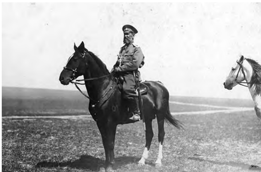
А.Е. Эверт перед смотром Забайкальской казачьей дивизии. 18 мая 1916 г. Архив И.В. Эверт

Андрей Ганин. Ирена Эверт «Я служил, но проглядел жизнь с ее радостями». После революционный дневник и торжественные письма генерала А.Е. Эверта. 1918 г.