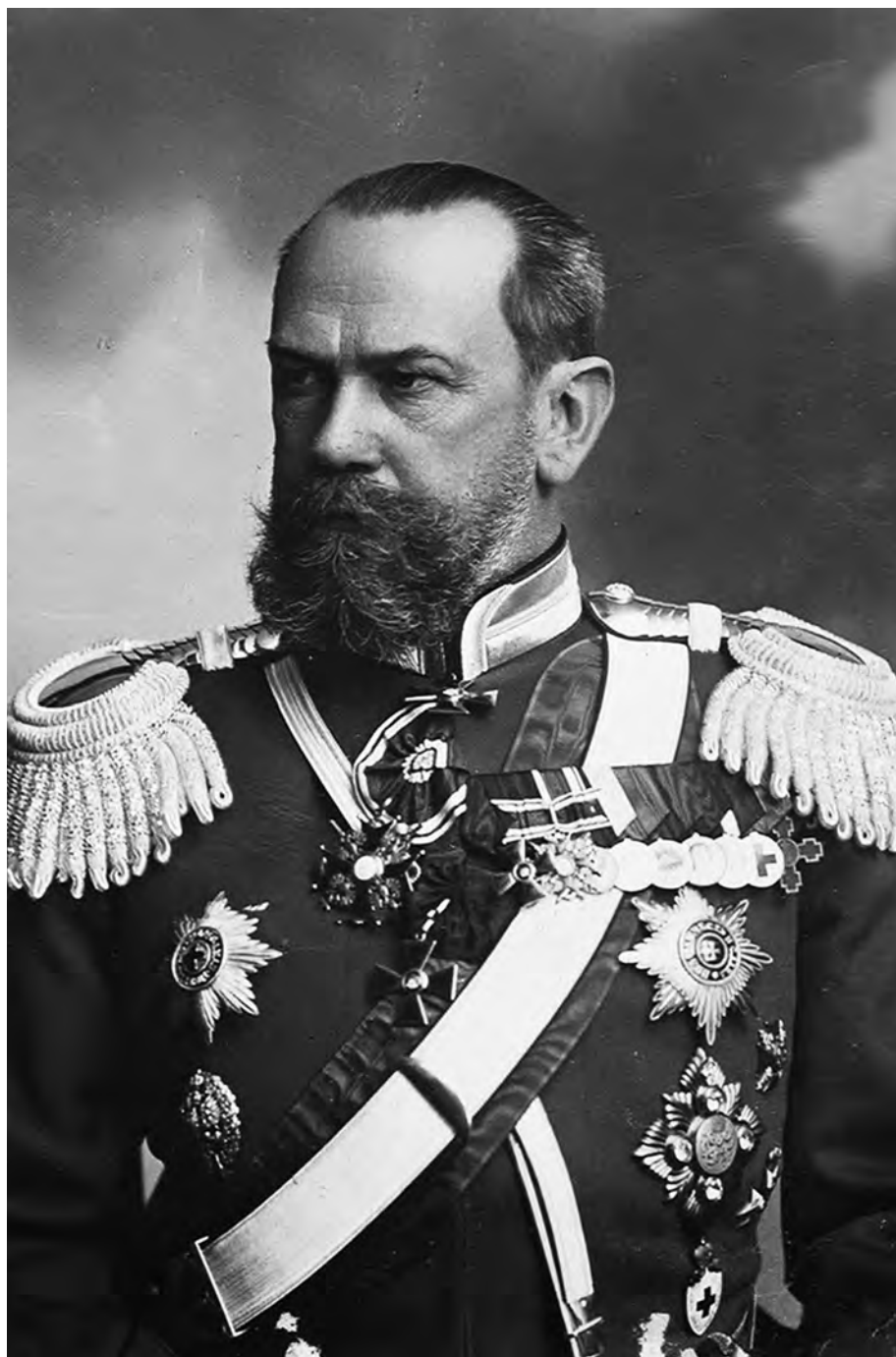
Генерал А.Е. Эверт

Андрей Ганин. Ирена Эверт — «Я служил, но проглядел жизнь с ее радостями». После революционный дневник и торемные письма генерала А.Е. Эверта. 1918 г.