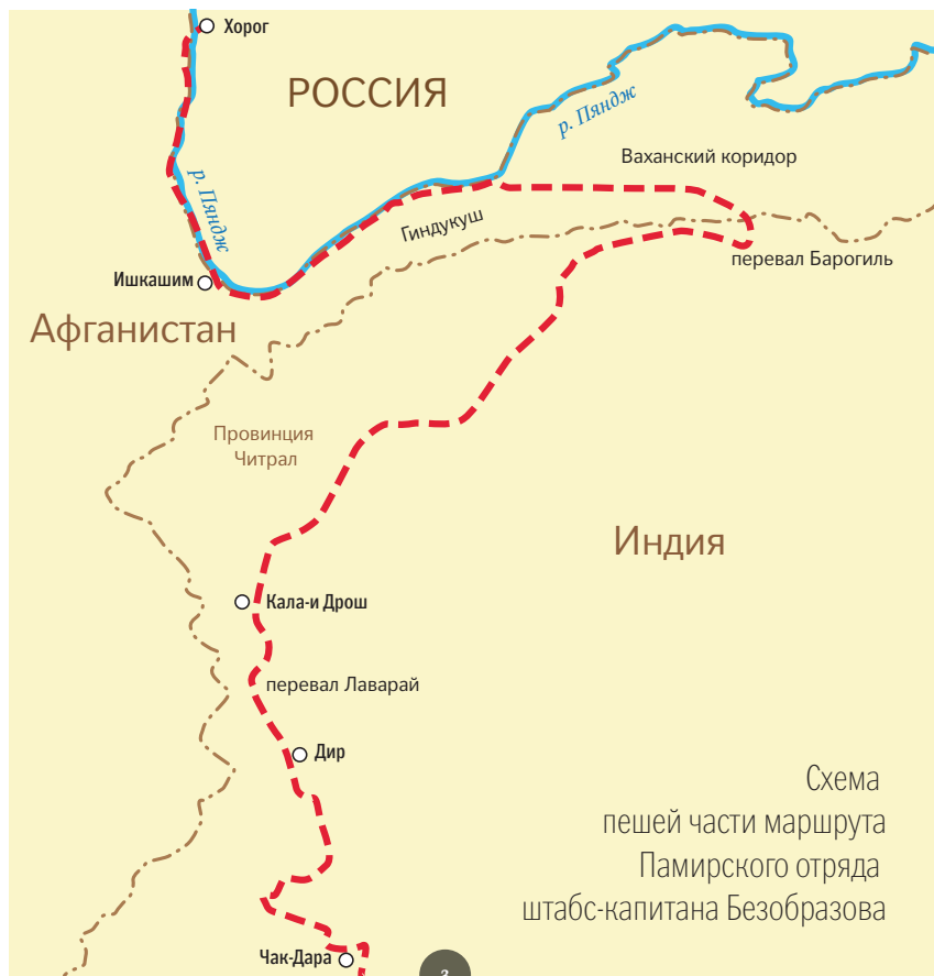
Схема пешей части маршрута Памирского отряда штабс-капитана Безобразова