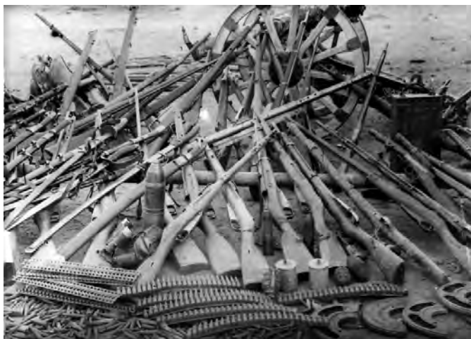
Оружие, захваченное при ликвидации отрядов Бакича