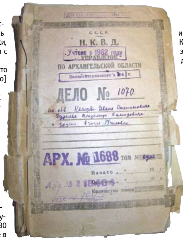
Обложка архивно-следственного дела И. С. Кашубы.

Будучи занят делом с утра до вечера, я не имел возможности ни посещать увеселительных мест, ни приобретать себе знакомых 20 . При этом Кашуба считал себя лишь слепым исполнителем: «Роль моя была настолько незаметной, что я был чисто простым исполнителем приказаний, касающихся специальной службы, как Нач[альника] бригады» 21 .